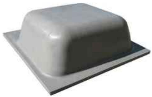
20 Qbeta de medidas 800x740x200mm.

The retrievable pans lighten the slab while the solid slab is supported by the wooden panels. The domed pan is manufactured with special plastic material to resist the weight of the concrete without deforming, while at the same time providing flexibility to facilitate striking.