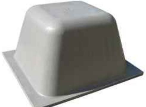
40 Qbeta de medidas 800x740x400mm.