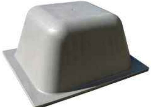
35 Qbeta de medidas 800x740x350mm.