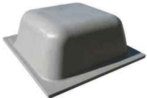
25 Qbeta de medidas 800x740x250mm.